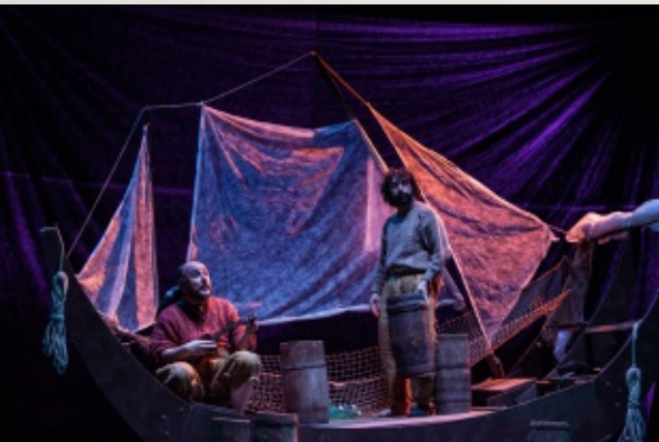
Bam! Bam! Teatro- "Capitani Coraggiosi"