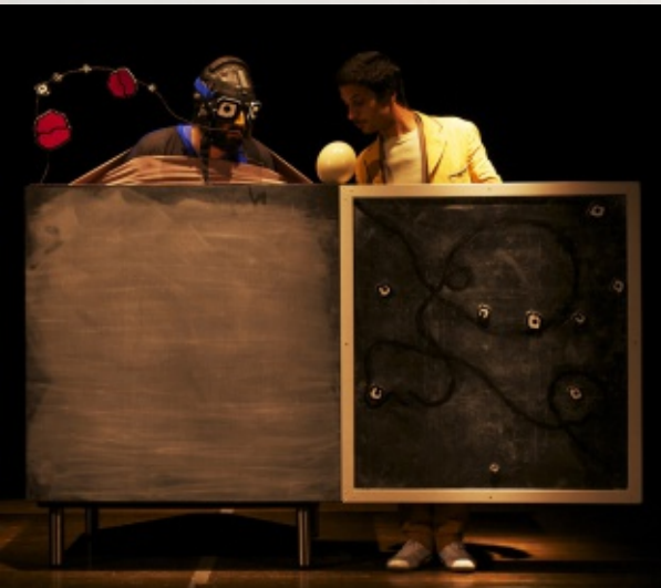
Gli omini - "L'uovo e il pelo"